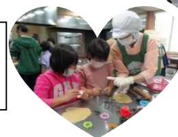
板柳町ふるさとセンターへ 行ってきました。 たのしかったよー(∇∇)/