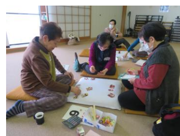
トランプ・花札大会