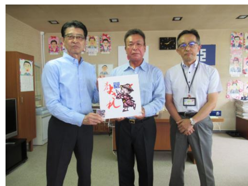
R6.8.5 黒石市長表敬訪問