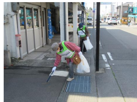
【V 連協クリーン作戦】