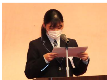
R7.1.26 ふくしの作文コンクール最優秀賞受賞作品の朗読発表