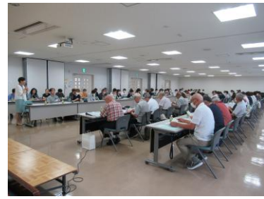
R6.8.29 先進地視察研修会(三沢市)