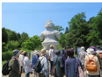
亀ヶ岡石器時代遺跡見学