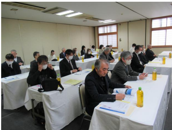
講演を聴く参加者