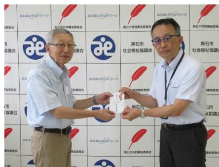
R6. 7.10 NTT 労働組合電電烏城会(寄付)