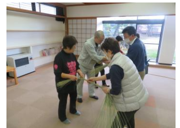
縄を絞めるの難しいな・・・ (い草の正月飾り作り)