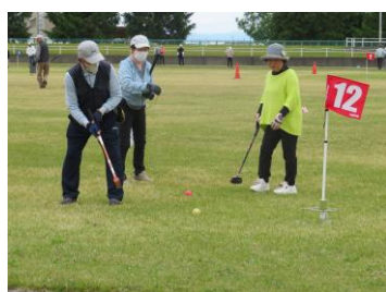
グラウンド・ゴルフ大会