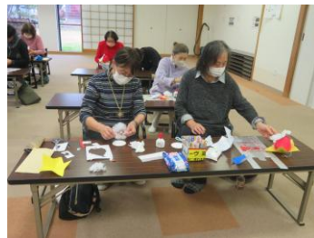
可愛いサンタさんになるかな? (ねぶたサンタ作り)