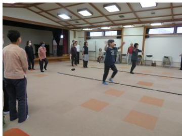
音楽に合わせて楽しく歩こう!! (リズム体操)