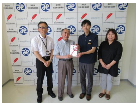
R6. 6.20 株式会社モバイル GoCo(寄付)