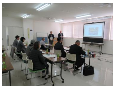
R6.11.5 災害時支援研修会