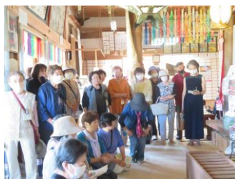
春光山円覚寺拝観