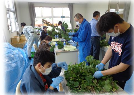
農福連携事業カシス収穫