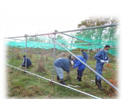
ブルーベリー雪囲い