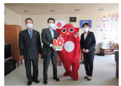
R2.9.23 黒石市長表敬訪問