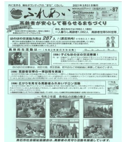
広報ふれあい第87号