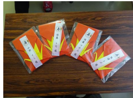
90歳頭彰おめでとうございます。 (長寿福祉大会式典は残念ながら未実施)