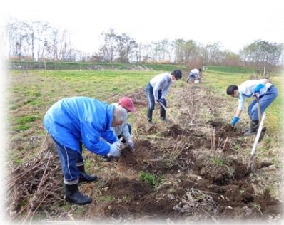
農福連携事業 菊芋収穫