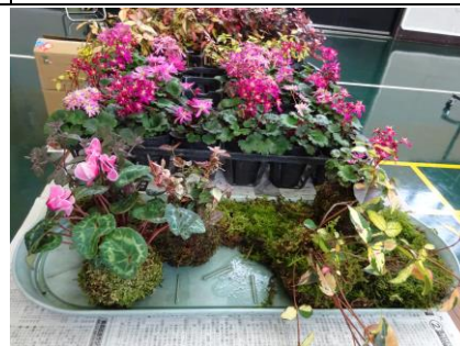
苔玉きれいにできました