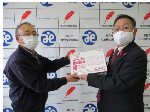
カロリーメイト贈呈 あおぞら作業所