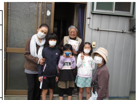
高齢者にプレゼントを配布