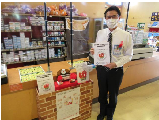
ピンバッジの設置 ダイナム黒石店