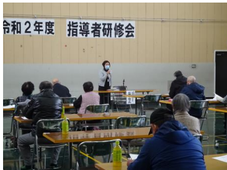
リーダーを目指して全集中