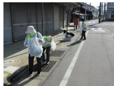
R2.9.5 クリーン作戦 (中町・前町・横町)