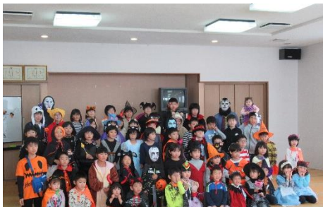
ハロウィンパーティー(ちとせ)