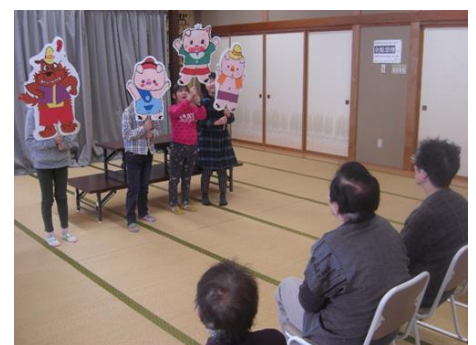
高齢者と「ペープサート」で交流