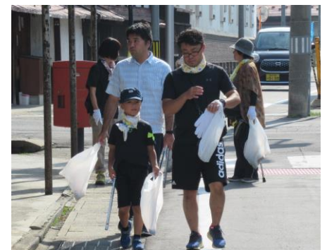
R1.8.31 クリーン作戦 (中町・前町・横町)