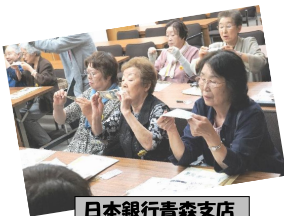
日本銀行青森支店