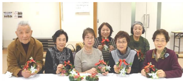
アメリカンフラワーのリース