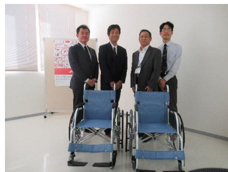
車椅子の寄贈 (株)みんゆう薬品