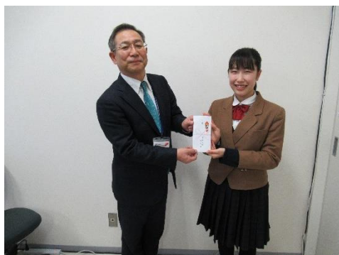
現金の寄付 黒石高校生徒会