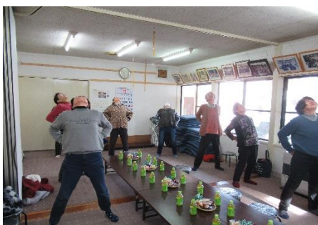
ふれあいサロン(南中野)

社協会費・共同募金は地区社会福祉協議会と協働により、小・中学校の福祉教育、在宅高齢者の見守り活動、児童の健全育成などの地域福祉活動に活用しています。