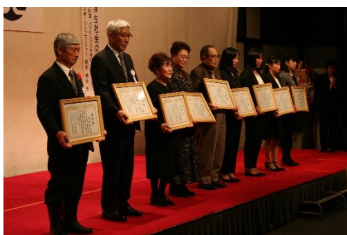
受賞者(表彰)の皆さま