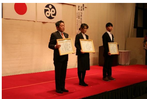
受賞者(感謝)の皆さま