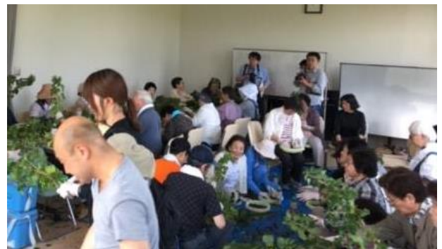
農福連携事業カシス収穫