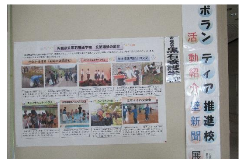
ボランティア推進校活動紹介(壁新聞展示)