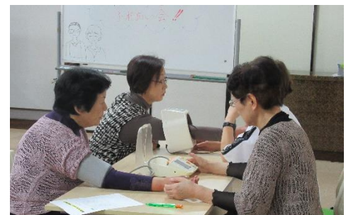
サロン前の血圧測定(桜木・春日)

社協会費・共同募金は地区社会福祉協議会と協働により、小・中学校の福祉教育、在宅高齢者の見守り活動、児童の健全育成などの地域福祉活動に活用しています。